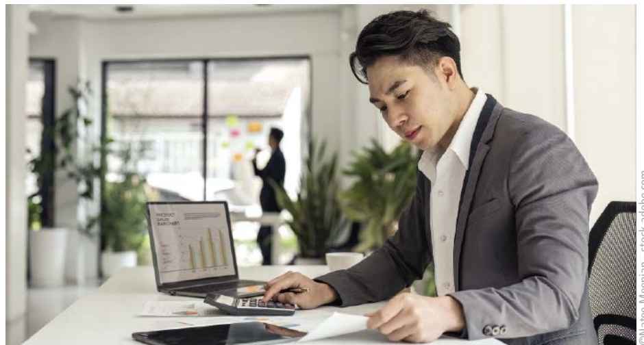
■ Abb. 2: Trotz der Frustration rund um Daten wissen die Menschen, dass ihre Entscheidungen ohne Daten weniger genau (40 %), weniger erfolgreich (18 %) und fehleranfälliger (42 %) wären.