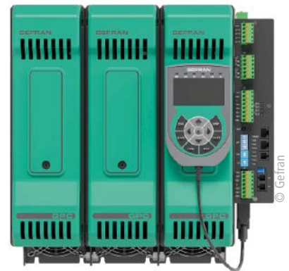
■ Abb. 3: Die GPC-Baureihe bildet die neueste Generation modularer Power Controller von Gefran.

Auch bei Gefran ist man froh über die harmonische Zusammenarbeit der beiden Firmen. Die gründliche Kenntnis der Prozesse und der Anforderungen an das Endprodukt Waffel seitens Hebenstreit war ausschlaggebend für die richtige Wahl der Komponenten und Konfigurationen. Man darf gespannt sein, welche wegweisenden Lösungen in Zukunft aus der hervorragenden