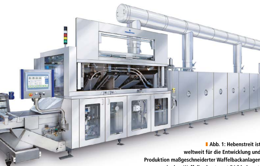
■ Abb. 1: Hebenstreit ist weltweit für die Entwicklung und Produktion maßgeschneiderter Waffelbackanlagen wie dem Waffelbackautomat BAC bekannt.

Hebenstreit ist weltweit als führender Hersteller von Maschinen und Anlagen für die Produktion von Waffeln und Snacks bekannt. Das Unternehmen bietet für jeden Prozessschritt der Herstellung maßgeschneiderte und aufeinander abgestimmte Lösungen – von der Teigzubereitung bis zur Konfektionierung der fertigen Backerzeugnisse. Für die Beheizung der Backplatten seiner Waffelbackanlagen setzt Hebenstreit neben Propan-, Butan- oder Erdgas künftig auch auf elektrische Wärmeerzeugung – deren Steuerung erfolgt durch Leistungsregler der GPC-Serie von Gefran.